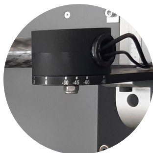
Angles de prise de vues prédéfinis