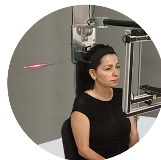
Laser de positionnement