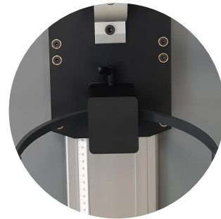
Appui-tête motorisé avec règle graduée