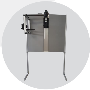
Panneaux latéraux repliables